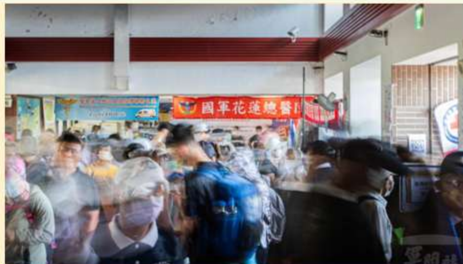
光復火車站醫療站